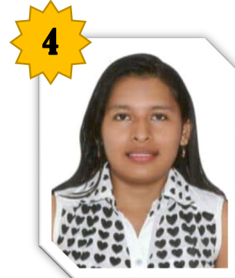
PAN BURGOS CLARA YICED